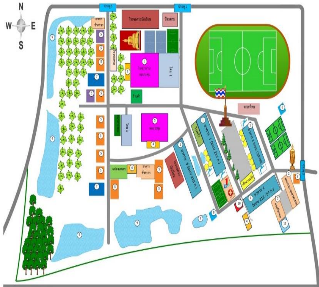
รายการประกอบแผนผัง